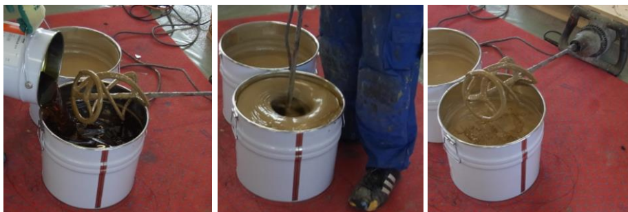
Anrühren des 2-Komponenten PU-Klebers

Der Bodenbelag wird in Rollen geliefert, welche 1-2 Tage bei einer Temperatur von 15°C bis 25°C zur Akklimatisierung dort gelagert werden müssen, wo sie verlegt werden sollen. Am Vortag der Installation den Bodenbelag lose ausrollen damit sich die einzelnen Bahnen entspannen. Vor der Installation sind die beiden Komponenten des Klebers zu mischen.