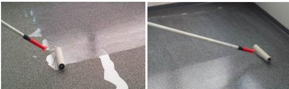
Auftragen der Versiegelung

Je nach Verwendungszweck sollte der Boden mit einer RZ turbo protect zero Versiegelung versiegelt werden. Grundsätzlich sollte der Belag im Indoorbereich versiegelt werden.