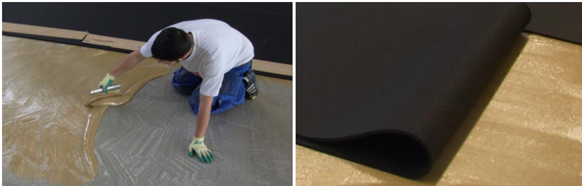
Kleberauftrag auf den sauberen Untergrund; ausrollen der Bahnen in das Kleberbett

Den Kleber mit einem Zahnspachtel gleichmäßig auf der Fläche verteilen auf der die Rolle ausgelegt wird. Für die Verlegung von SPORTEC® giga ist ein geeigneter 2-Komponenten Polyurethan Kleber und ein Zahnspachtel mit einer Zahnung TKB A3 zu verwenden. Anschließend wird die Rolle in das Kleberbett ausgerollt (Ablüftzeit /Setzzeit des Klebers beachten).