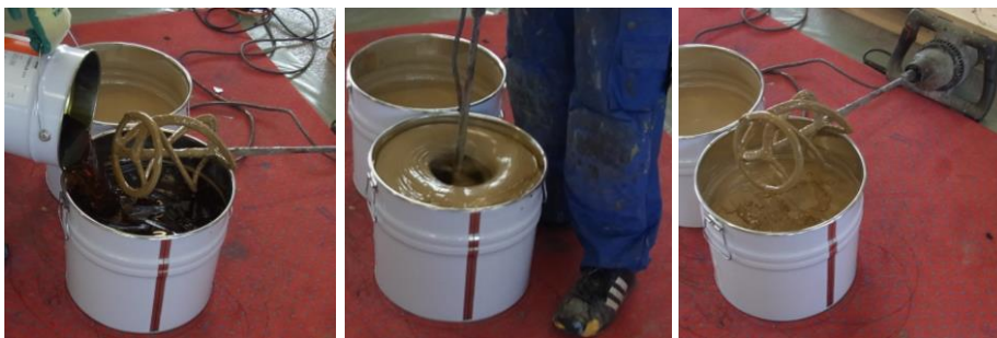
Anrühren des 2-Komponenten PU-Klebers

Der Bodenbelag wird in Rollen geliefert, welche 1-2 Tage bei einer Temperatur von 15°C bis 25°C zur Akklimatisierung dort gelagert werden müssen, wo sie verlegt werden sollen. Am Vortag der Installation den Bodenbelag lose ausrollen damit sich die einzelnen Bahnen entspannen. Vor der Installation sind die beiden Komponenten des Klebers zu mischen.