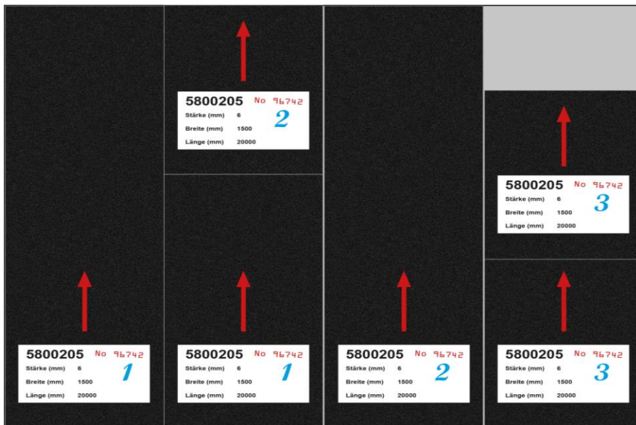
Ausrollen der fortlaufenden Bahnen in die gleiche Laufrichtung

Dabei ist allerdings genau darauf zu achten dass die Rolle mit der Unterseite (diese hat ein Etikett) nach unten verlegt wird und gerade ausgerollt wird. Die Bahnen immer in die gleiche Laufrichtung und Stoß an Stoß verlegen, so dass keine Fuge zwischen den Bahnen bleibt.